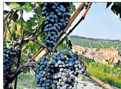
Weltbekannt ist das italienische Weinbaugebiet Piemont. Von dort kommt der Barolo und der Spitzenwinzer Angelo Gaja, der im Saalbau in Neustadt einen Vortrag halten wird.