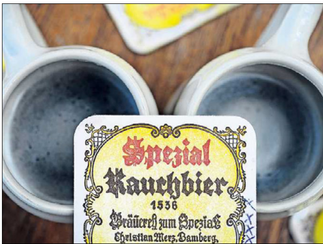
Rauchbier in Steinkrügen steht im Biergarten Spezial-Keller auf einem Tisch. In Bamberg gibt es zehn Brauereien, die über 50 verschiedene Biere herstellen.