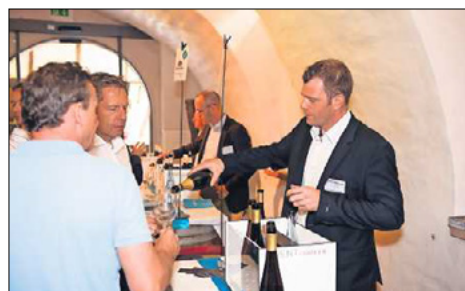
Mehr als 70 renommierte Weingüter gaben sich zur „Veritable“ im Aloisiushof in St. Martin die Ehre.

All dies kommt rüber in einer Mischung aus staatstragend und großväterlich, gesalzen mit einer gewissen Strenge, die dann Ausdruck findet, wenn ihm etwas ganz besonders wichtig ist. Zum Ende hin beispielsweise sein Plädoyer für Authentizität und Bodenständigkeit: „Sucht nie nach dem perfekten Wein, denn es gibt ihn nicht. Ich weiß nicht einmal, was das überhaupt sein soll.“ Gleiches gilt fürs Essen. Vielmehr fordert er eine DOC, also einen Herkunftscharakter für einfache Speisen wie Tagliarini (dünne piemontesische Pasta), Carne Crudo (Tartar), Vitello Tonnato und Insalata Russo. Weg vom Geheisse der Sternerestaurants, hin zu dem, was die Region unverwechselbar macht. Der Mann hat einfach Stil.