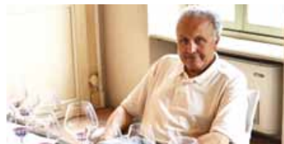
Winzer-Legende Angelo Gaja ist bei der „Véritable 2014“ Aussteller und Vortragender

Information, Ausstellerverzeichnis und Anmeldung auf: www.veritable.info