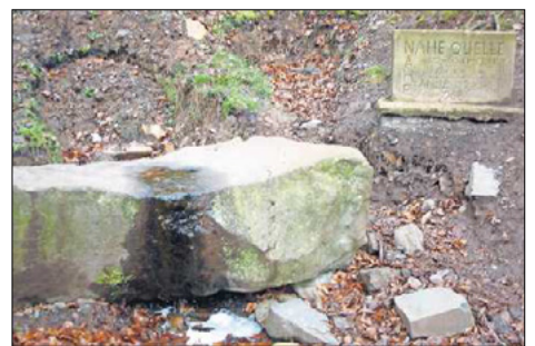
Kaum zu glauben, dass aus diesem Rinnsal mal ein richtiger Fluss werden soll: Die Nahequelle bei Nohfelden.

Wer noch andere tolle Wege erkunden möchte, hat vielfältige Möglichkeiten, darunter einige attraktive Premiumwege in unmittelbarer Nähe, so den Bärenpfad ab Nohfelden,