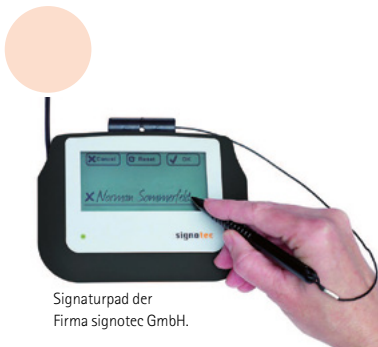
Signaturpad der Firma signotec GmbH.

Im Jahr 2012 erzielten Unternehmen in Deutschland 12 Prozent des Gesamtumsatzes mit Online-Verkäufen. Laut Statistischem Bundesamt vertrieb fast jedes fünfte Unternehmen seine Waren oder Dienstleistungen neben herkömmlichen Vertriebswegen auch über das Internet oder über andere computergestützte Netzwerke mittels elektronischen Datenaustauschs (EDI = Electronic Data Interchange). Die Ergebnisse für Deutschland zeigen, dass Unternehmen bei elektronischen Verkäufen verstärkt auf Websites setzen: 93 Prozent der Unternehmen mit Online-Handel erhielten Bestellungen von Waren oder Dienstleistungen über eine Website und 21 Prozent in strukturierter Form über EDI. 14 Prozent der Unternehmen mit Online-Handel bezogen Bestellungen über beide Formate, Website und EDI.