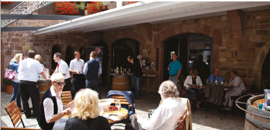
Gutes Ambiente, gutes Wetter, interessante Aussteller: Die Veritable 12 konnte ihren Erfolg steigern

Schöne Räumlichkeiten, eine umsichtige, eifrige Organisation, Top-Aussteller sowie zahlreiche qualifizierte Fachbesucher machten die Veritable 12 zu einem Gewinn für alle Beteiligten. Und auch das Wetter hatte ein Einsehen.