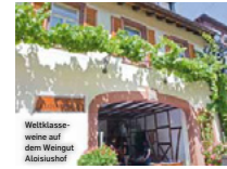
Weltklasse- weine auf dem Weingut Aloisushof

mit Spießbratenessen im Hof. Eintritt frei. T: +49(0)6323/20 99, www.aloisushof.de .